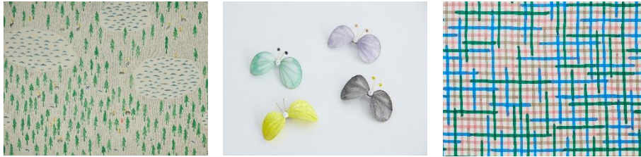
ミナ ペルホネンのアーカイブデザインより 左から “one day” “choucho” “minamo”