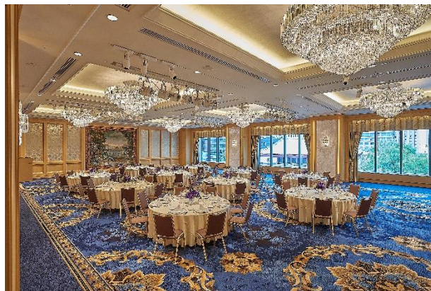
マナーハウスをイメージした宴会場 メイプル

※チケットをご購入いただいたお客様には、特別料金でご宿泊いただけるお得なお案内もございます。