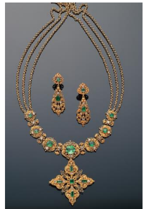
エメラルド&ダイヤモンドゴールドセット(1830年頃)

入館料：一般 ¥1,300 / 大学生・高校生 ¥1,000 / 中学生以下 無料