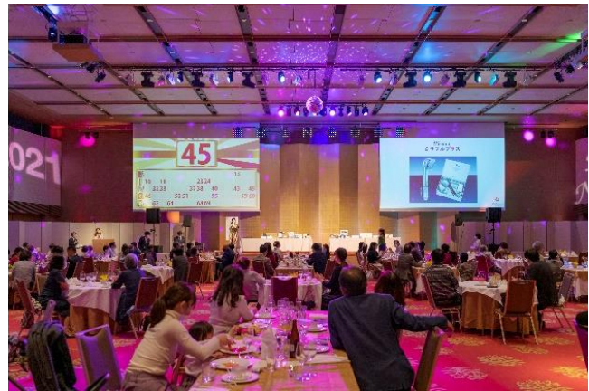
* 画像は過去に開催したものです。

館内 9 会場（面積計：8,402 m 2 稼働時間計：60.5 時間）で使用される電気を「CO 2 ゼロ MICE」を活用して再生可能エネルギーに置き換えます。SDGs 気候変動に具体的な対策として、2050 年カーボンニュートラル、脱炭素社会の実現を支援します。